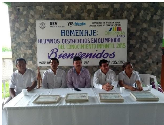
Al evento asistieron autoridades educativas de los tres municipios que conforman la Zona Escolar 049.