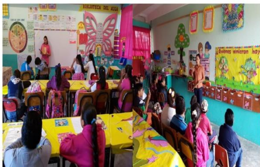
FOTOGRAFÍA 5: PARTICIPACIÓN DE PADRES DE FAMILIA

Una vez realizado lo anterior el lector acompañante (papá, mamá o ambos) nos visitan en el aula y nos comparten el texto leído y lo más bonito de todo esto es ver fortalecida esa relación padre e hijo, así como el interés de ambos al realizar esta actividad, pues se presentan, comentan el tipo de texto que se llevaron, nos cuentan de qué trata y sus hijos complementan la participación de sus papás, algunos cuestionan reflexivamente sobre el tema y posteriormente se les brinda un aplauso y agradecimiento por hacer partícipes en la formación de sus hijos.