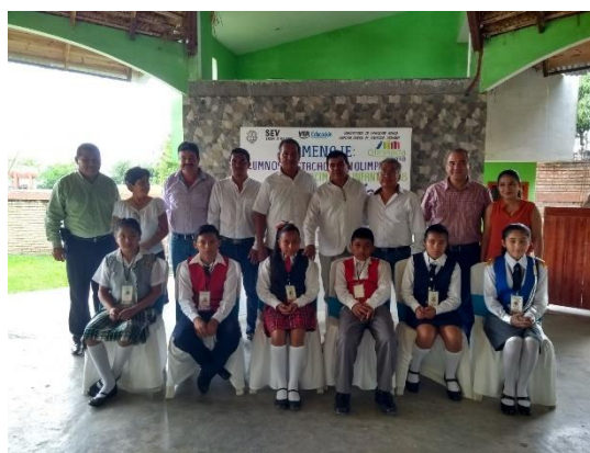
Autoridades educativas, maestros y alumnos conviviendo en este día especial.